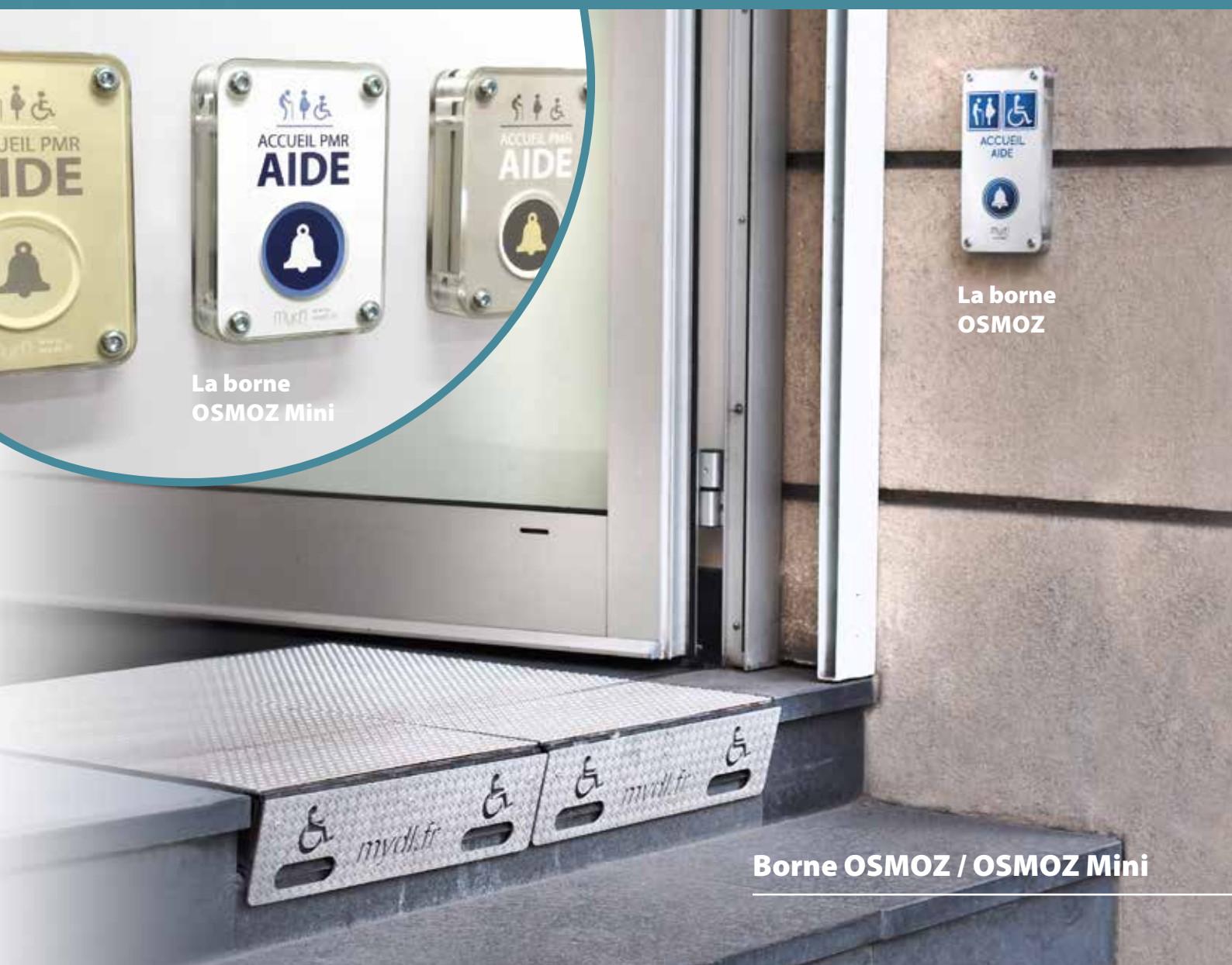
La borne OSMOZ Mini